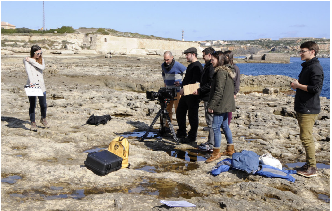
Momento del rodaje en los alrededores de la Cala Sant Esteve.